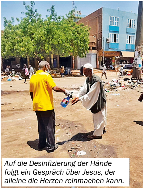
Auf die Desinfizierung der Hände folgt ein Gespräch über Jesus, der alleine die Herzen reinmachen kann.

Dabei begann unser „Desinfektions-Projekt“ nicht sehr positiv. Gleich am