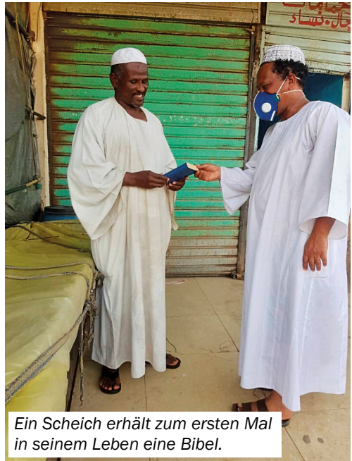
Ein Scheich erhält zum ersten Mal in seinem Leben eine Bibel.

Anfang Mai erlebten wir allerdings eine schöne Überraschung. Der Stellvertreter des Regierungsrates in Khartum rief mich persönlich an und erteilte mir eine Sondergenehmigung, um im ganzen Land unterwegs sein zu dürfen. Dank dieser ‚Sondergenehmigung‘ konnten wir Mitte Mai unser „Desinfektions-Projekt“ starten. Zusammen mit fünfzehn Jugendlichen meiner Gemeinde desinfizierten wir drei Tage lang die Hände der Passanten auf dem größten Lebensmittel-Wochenmarkt von Khartum und erklärten ihnen, wie sie sich vor Corona schützen können.